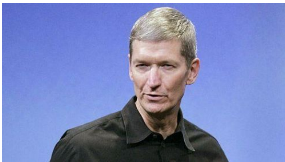
苹果公司 CEO 蒂姆·库克

北京时间 10 月 30 日晚间消息，苹果 CEO 蒂姆·库克(Tim Cook)今日在《商业周刊》网站发表文章称，身为同性恋者我感到很自豪。