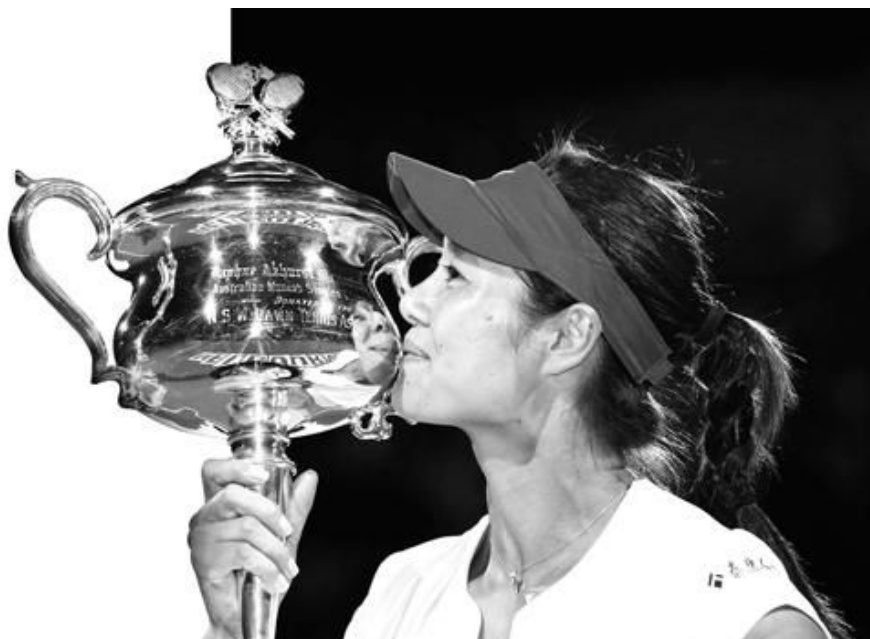
图为李娜首次澳网夺金后亲吻达芙妮·艾克哈里斯特纪念杯。