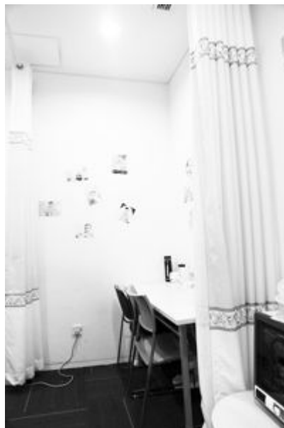
完美世界软件有限公司“妈咪屋”内一角。

冰箱、饮水机、微波炉、电风扇，各种电器一应俱全，可爱的桌椅，舒服的沙发，粉色的桌布……十几平方米的小房间里，处处透露出温馨舒适的氛围——这里是北京市中关村科技园百思特科技有限公司的“妈咪屋”。