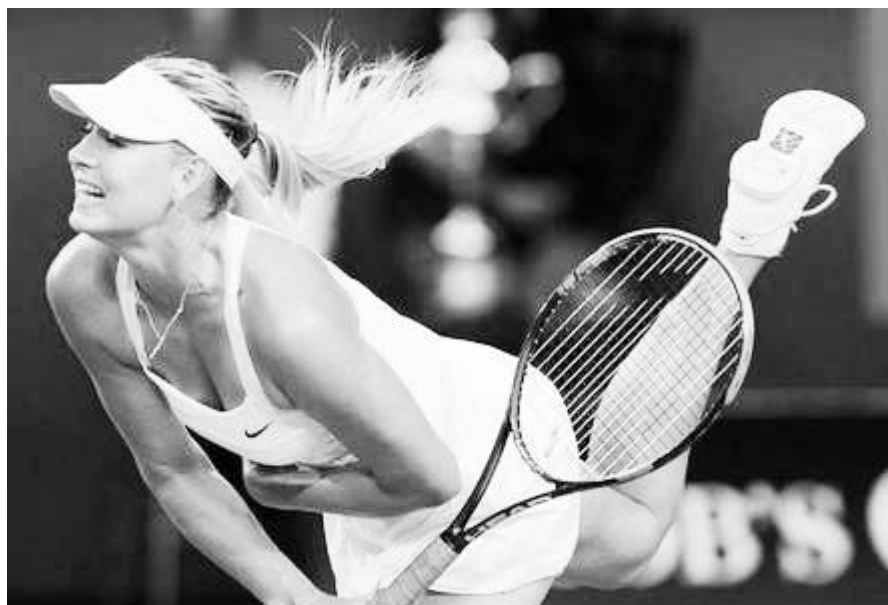
图为俄罗斯网球名将莎拉波娃，她的奋斗经历激励了无数少男少女。

9月19日，中国网球名将李娜通过微博正式宣布退役。在网球土壤贫瘠的中国，李娜两次夺得大满贯冠军——2011年，勇夺法网冠军，今年又在澳网登顶，手握两座大满贯的冠军奖杯，WTA最高排名是第二位，职业生涯总战绩503胜188负，总奖金超过了1670万美元。