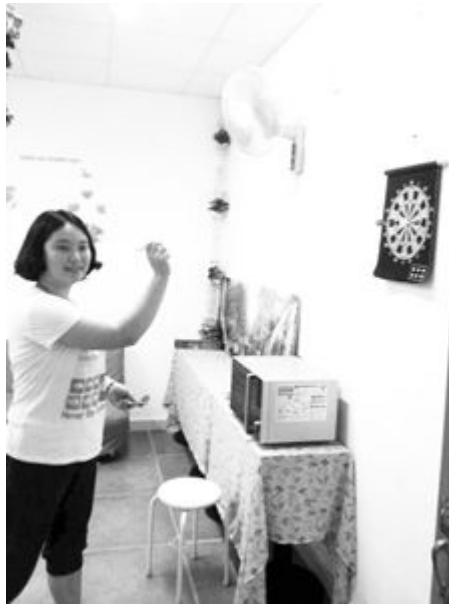
百思特科技有限公司女职工在“妈咪屋”玩飞镖。